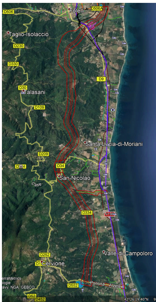
Fuseau d'étude de 2009 entre A Penta di Casinca et Cervioni

L'ex-Collectivité territoriale de Corse a donc réservé un fuseau d'étude en 2009, suivant un arrêté de prise en considération de mise à l'étude en date du 6 novembre 2009.