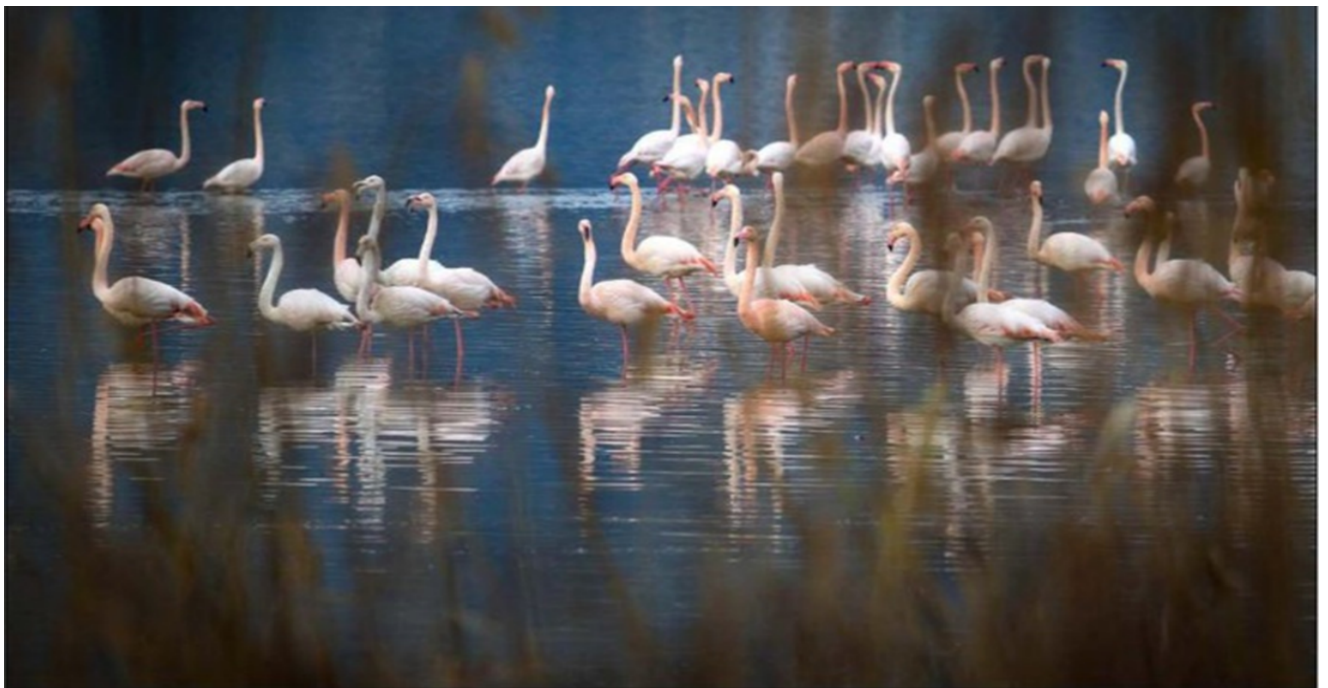
Etang de Biguglia

Le SDAGE élargit son champ d'action en prenant en compte les enjeux d'adaptation et de gestion liés au changement climatique, en élargissant la gouvernance. Demeure cependant la nécessité d'envisager des actions pour rationaliser l'utilisation de l'eau.