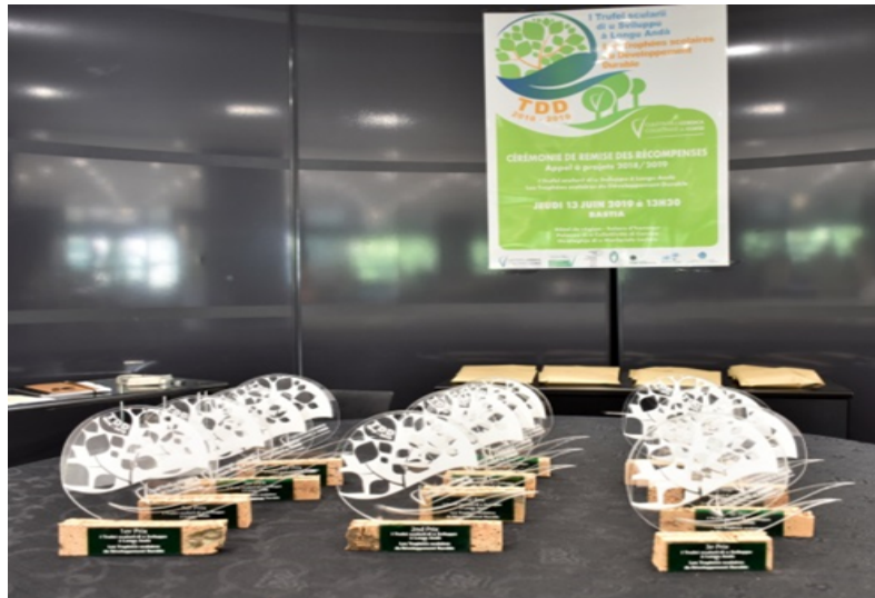
Trophées scolaires du Développement Durable