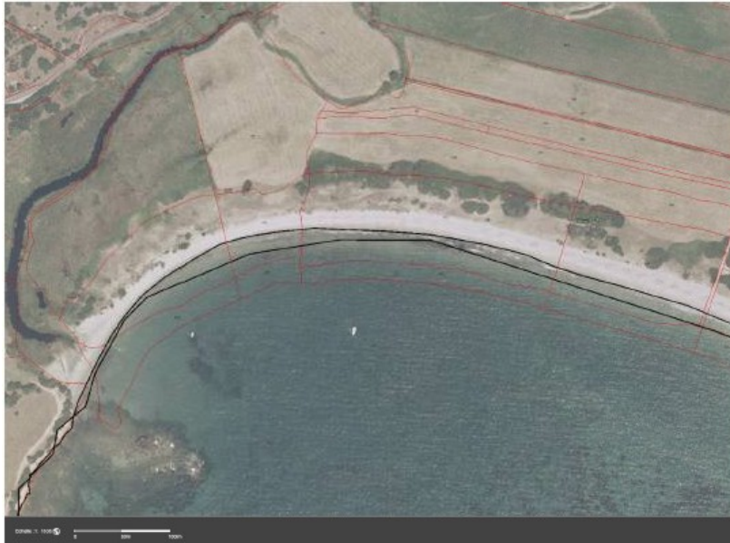
Superposition du cadastre et d'ortho photo 2003

Pour la plage du Taravu, les actions envisagées sont :