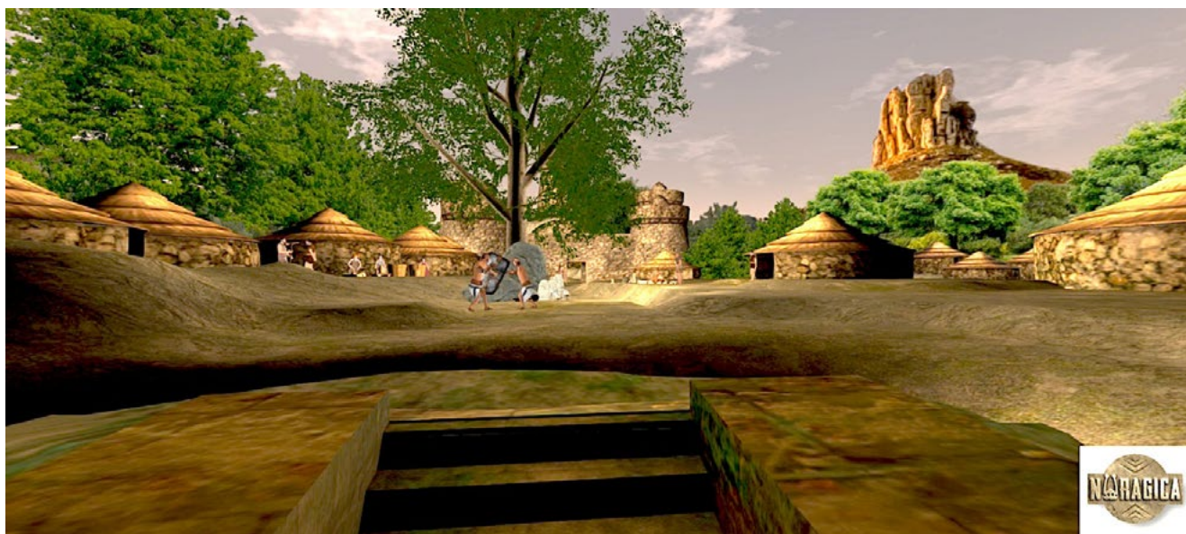
Extrait film 3D, © Nova Istoria