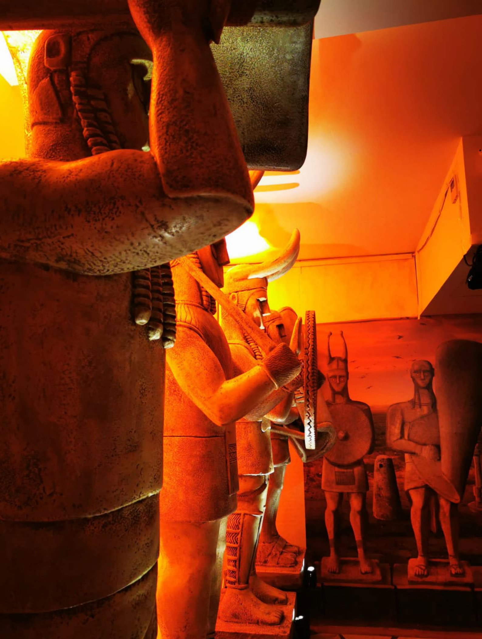
Reproduction à l'échelle 1:1 des géants de Mont' e Prama