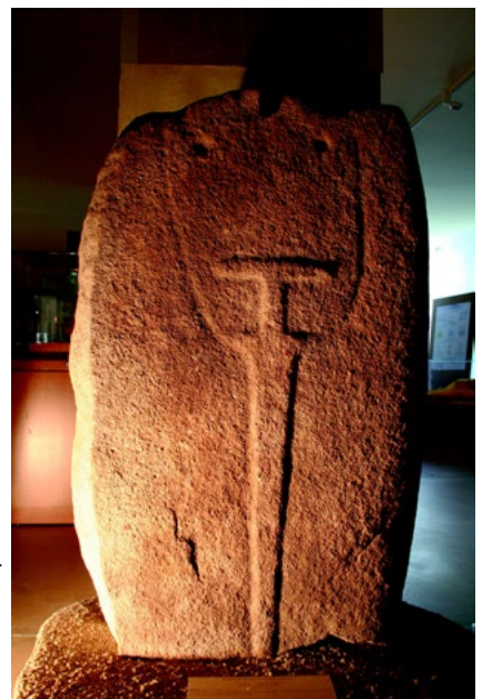
Fragment de la statue-menhir Aravina I

Dès le début de l'âge du Bronze, le sud de la Corse se couvre d'habitats fortifiés, les casteddi, alors que le territoire est ponctué de menhirs et statues-menhirs. Ces dernières représentent des chefs portant des attributs guerriers. L'apparition de ces élites, dont le pouvoir se fonde sur le contrôle des réseaux d'approvisionnement en métal et sur les capacités de stockage des ressources alimentaires, répond à un climat de tension. Du fait de nouveaux besoins (cuivre, étain, verre), les relations maritimes à distance se développent. Les sites de Cucuruzzu et d'Araghju constituent des exemples d'habitats de cette époque.