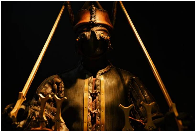
Guerrier nuragique, © Nova Istoria

l'ambition de rapprocher de nouveaux publics des musées.