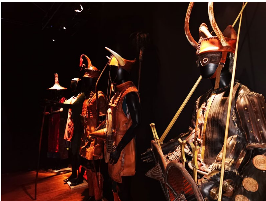
Reproduction de costumes nuragiques, ©Nova Istoria

Grâce à un travail conjoint entre experts corses et sardes, les contenus de Nuragica ont été enrichis par des parallèles sur l'évolution de la Corse, ses contacts et ses points communs avec la Sardaigne, notamment grâce à des découvertes récentes et, pour certaines, inédites.