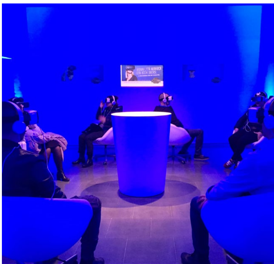
Salle de réalité virtuelle