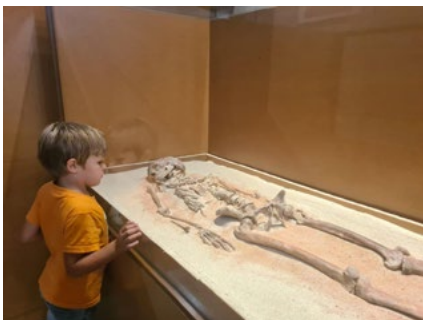
La dame de Bonifacio

Le premier peuplement connu de la Corse se fait vers -9000, avec l'arrivée de petits groupes par bateau. Afin de se nourrir, ces communautés pratiquent la prédation (pêche, piégeage, collectes diverses). Pour fabriquer leurs outils, ils utilisent des ressources essentiellement locales. Probablement nomades, ils occupent des abris naturels ou établissent des campements de plein air. Quelques tombes en grotte illustrent des pratiques funéraires complexes. Ces populations semblent disparaître vers -6400.