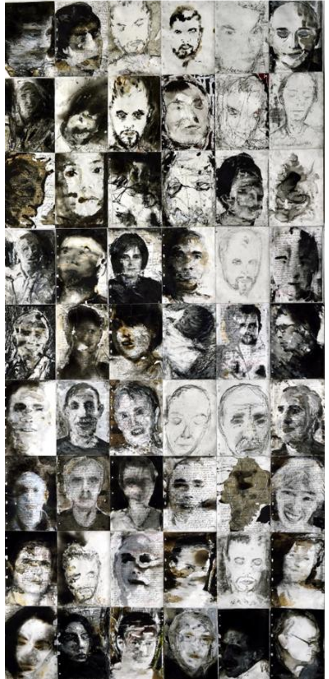
Fonds association e Cime

Le visiteur est invité à une expérience unique, où les éléments dialoguent et où chaque visage devient le lieu d'une rencontre, entre mémoire intime et humanité partagée.