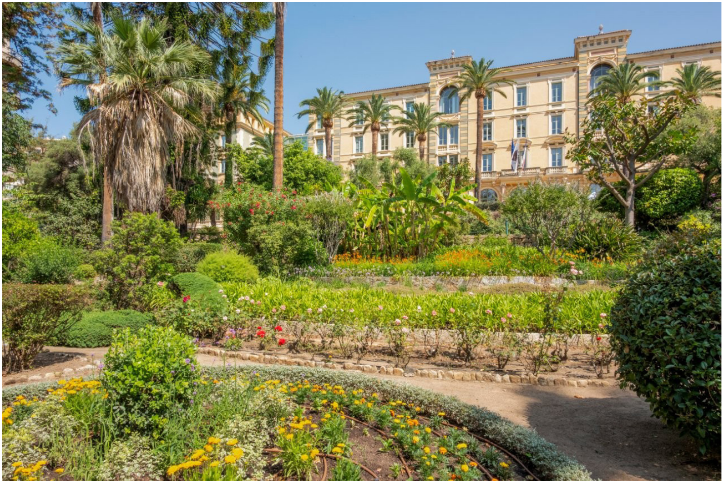
Jardins de la Collectivité de Corse