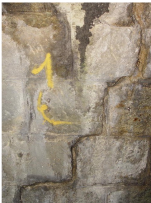
Tunnel de POGHJU – Fissure transversale millimétrique instrumentée