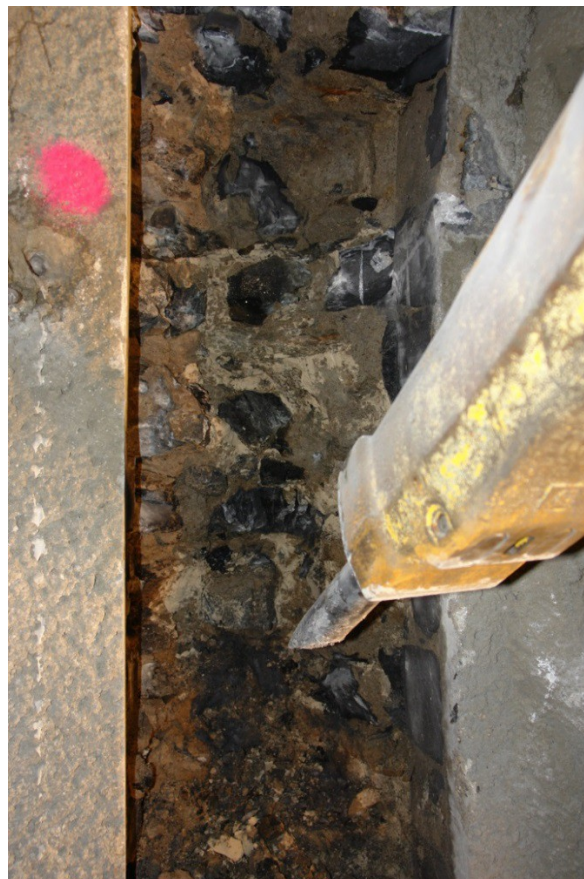
Tunnel de PONTE ROTTO – Réalisation de nervures à l'intérieur du parement en maçonnerie