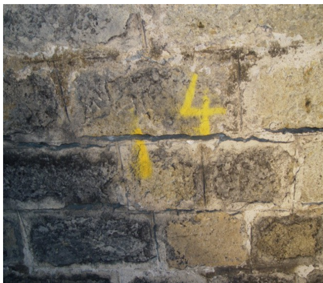
Tunnel de POGHJU – Fissure longitudinale en rein droit de millimétrique