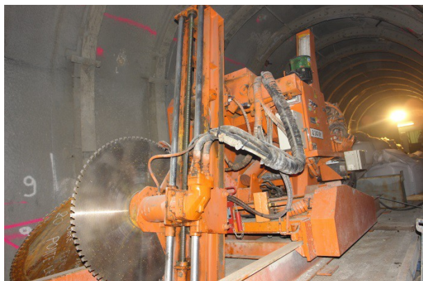
Tunnel de PONTE ROTTO – Béton projeté – Matériel de prédécoupage de la maçonnerie