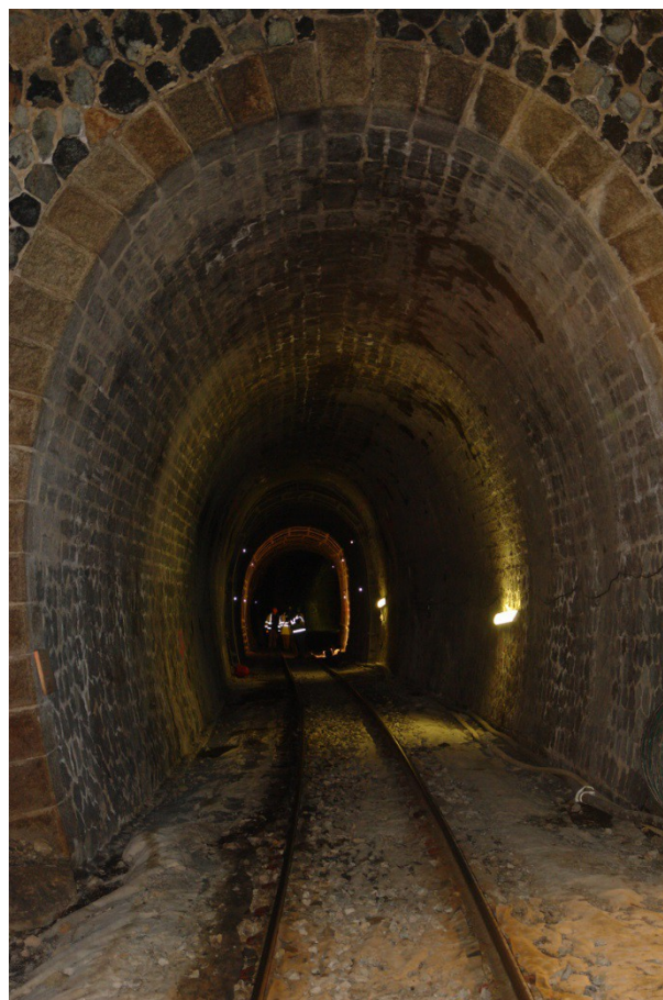
Tunnel de PONTE ROTTO