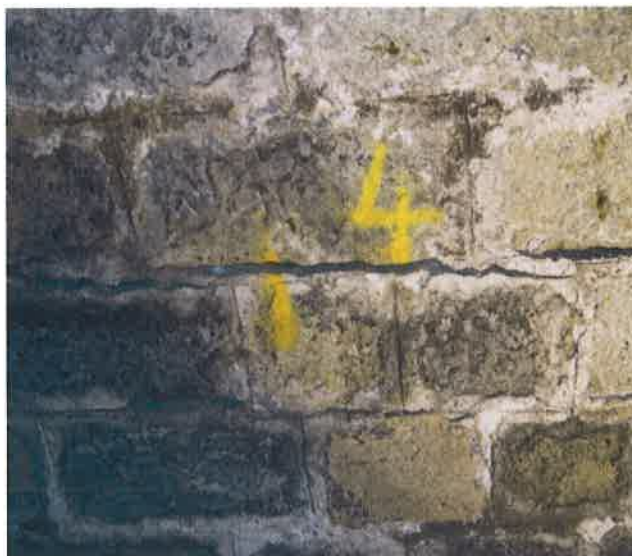
Tunnel de POGHJU - Fissure longitudinale en rein droit de millimétrique