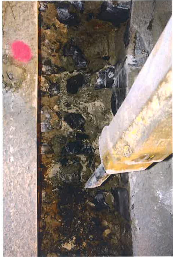
Tunnel de PONTE ROTTO - Réalisation de nervures à l'intérieur du parement en maçonnerie