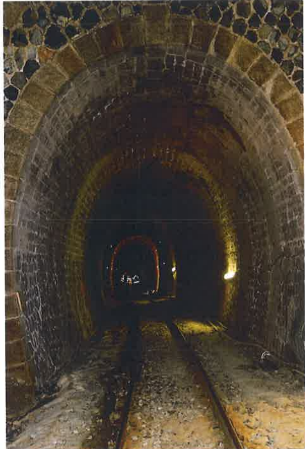
Tunnel de PONTE ROTTO - Béton projeté - Matériel de prédécoupage de la maçonnerie