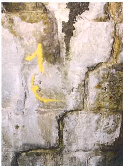
Tunnel de POGHJU - Fissure transversale millimétrique instrumentée