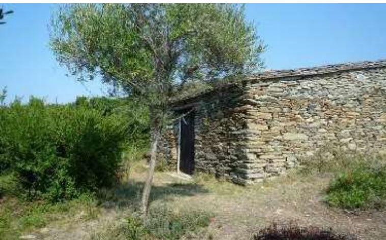
Maisonnette Cala Francese

Actions de gestion : Surveillance de l'état du bâti et du mobilier intérieur, réparation des petites dégradations occasionnelles. Les abords de l'abri doivent être régulièrement dégagés et nettoyés. Réalisation de petits travaux de restauration si nécessaire (porte en bois, pierre descellée...). Le sentier d'accès doit rester discret.