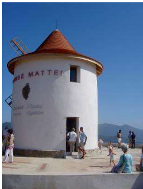
Ouverture du Moulin Mattei en saison

Accès : La chaîne doit rester fermée pour interdire l'accès aux véhicules. Le Conservatoire du littoral et le Gestionnaire disposent chacun d'un double de clef du cadenas de cette chaîne.