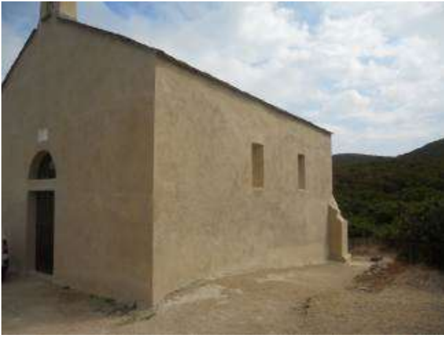
Chapelle Santa Maria restaurée