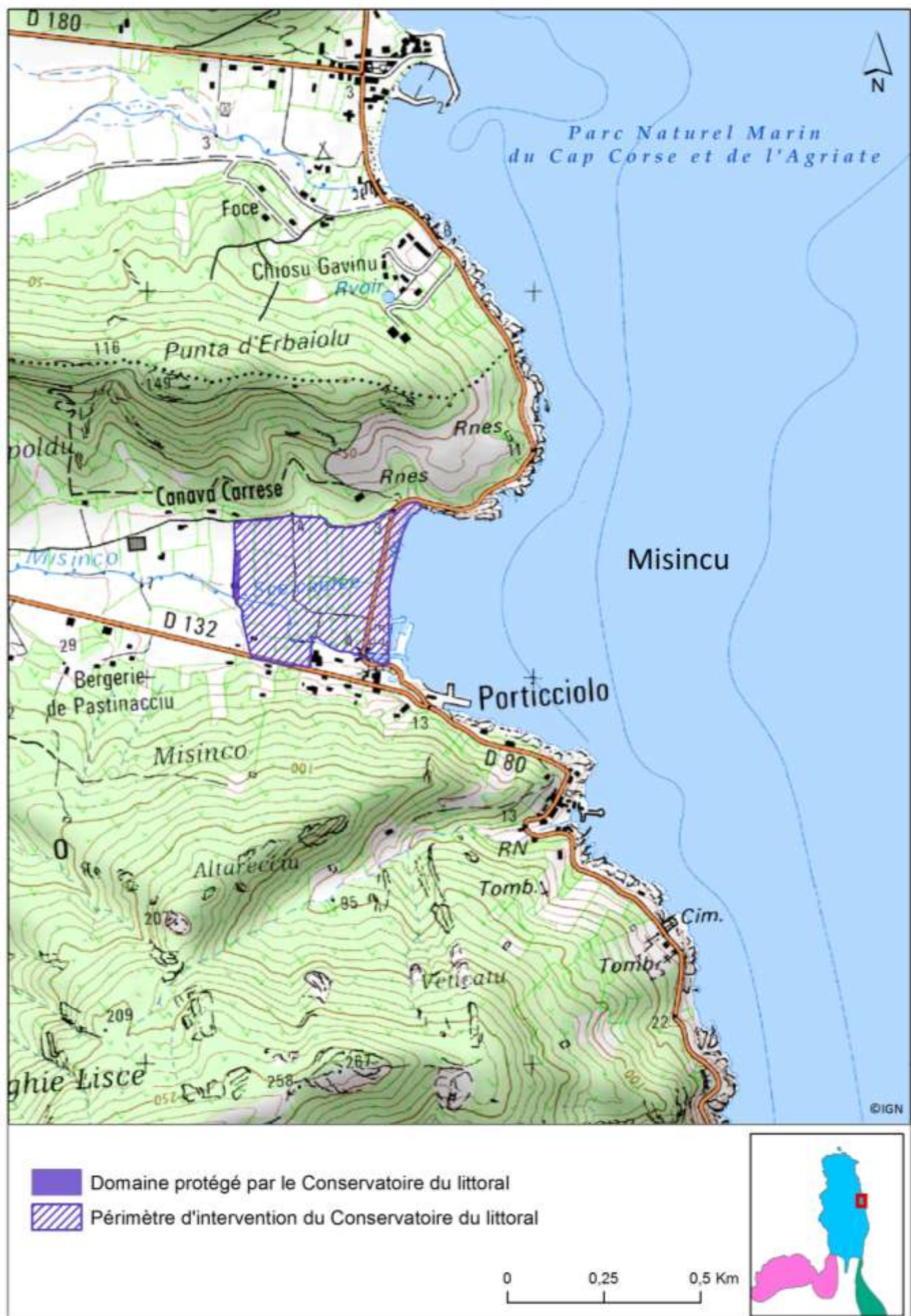
Site de Misincu