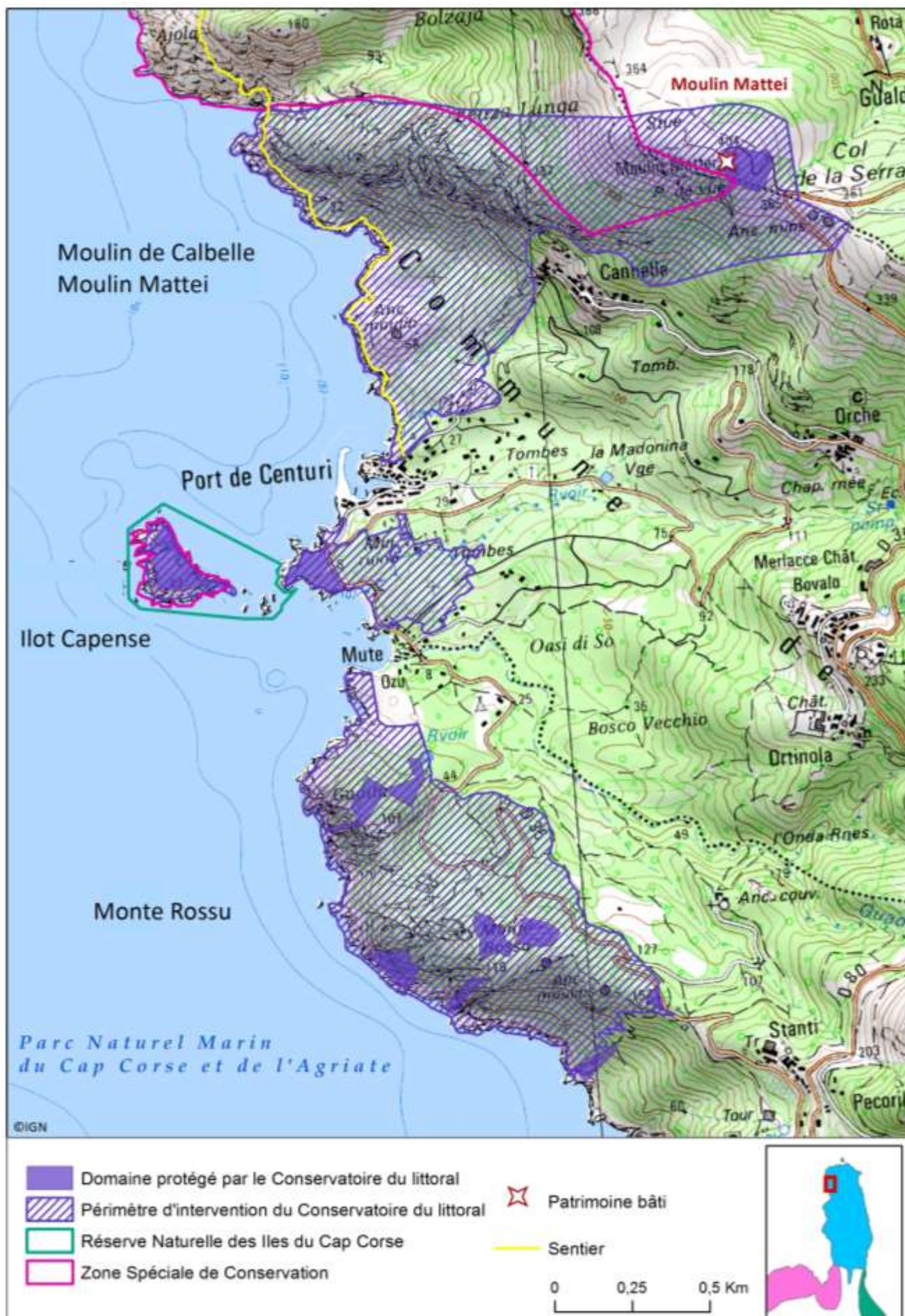
Sites de Moulin de Calbelle - Moulin Mattei, Îlot Capense et Monte Rossu