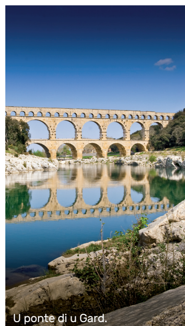
U ponte di u Gard.

Hè Scipione Nasica chì chjode sta cunquista, ciò chì li derà unu di i so tituli di gloria. In u 259 nanz'à Ghj.C., i Rumani si piglianu à Aleria, in Corsica. L'isula diventa « pruvincia imperiale » sott'à Augustu (63 nanz'à Ghj.C. / 14 dop'à Ghj.C.).