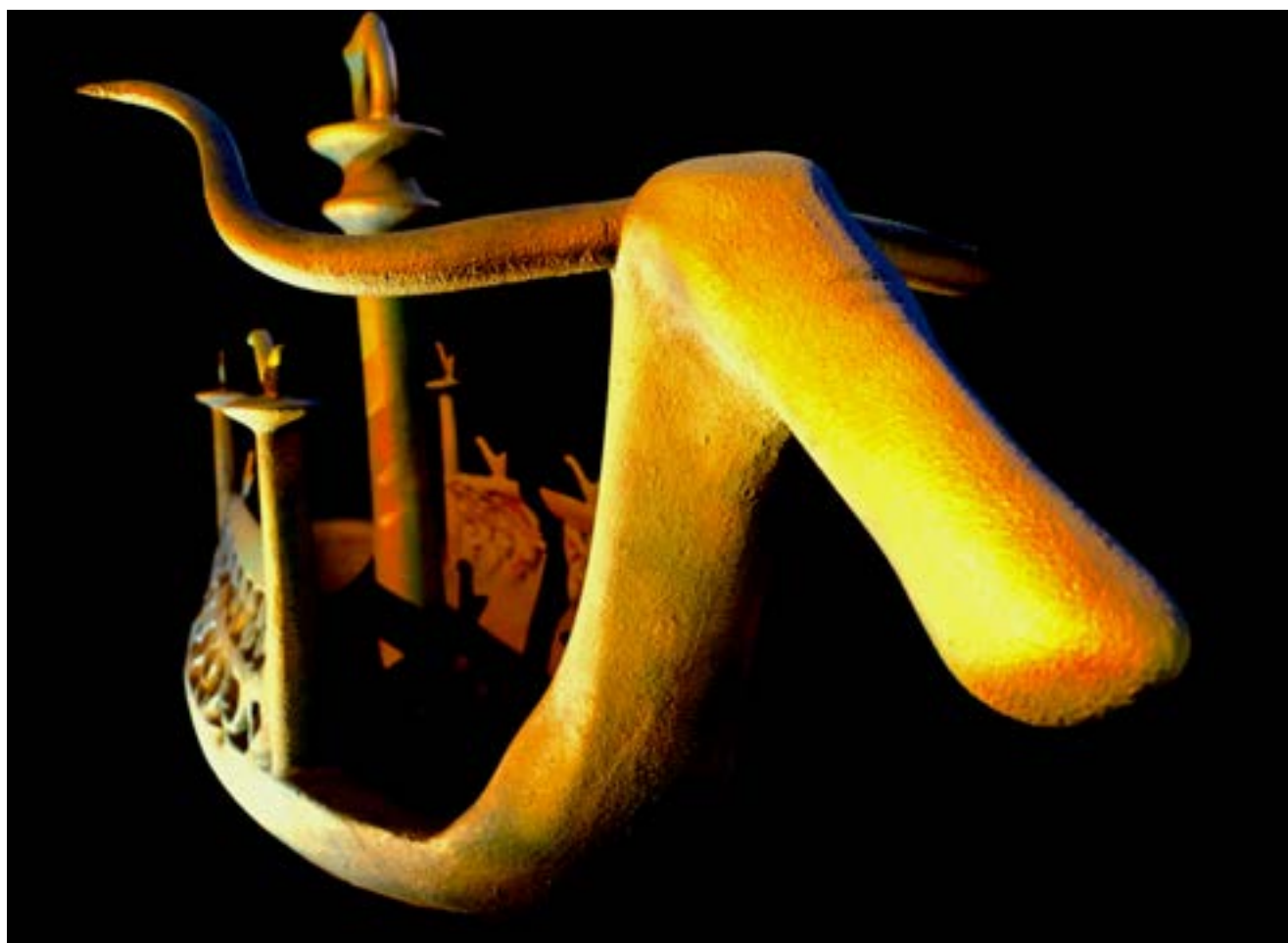
Reproduction d'une embarcation nuragique

Galerie de reproductions de costumes d'époque, exposés sur des mannequins, inspirés de personnages de statuettes en bronze ;