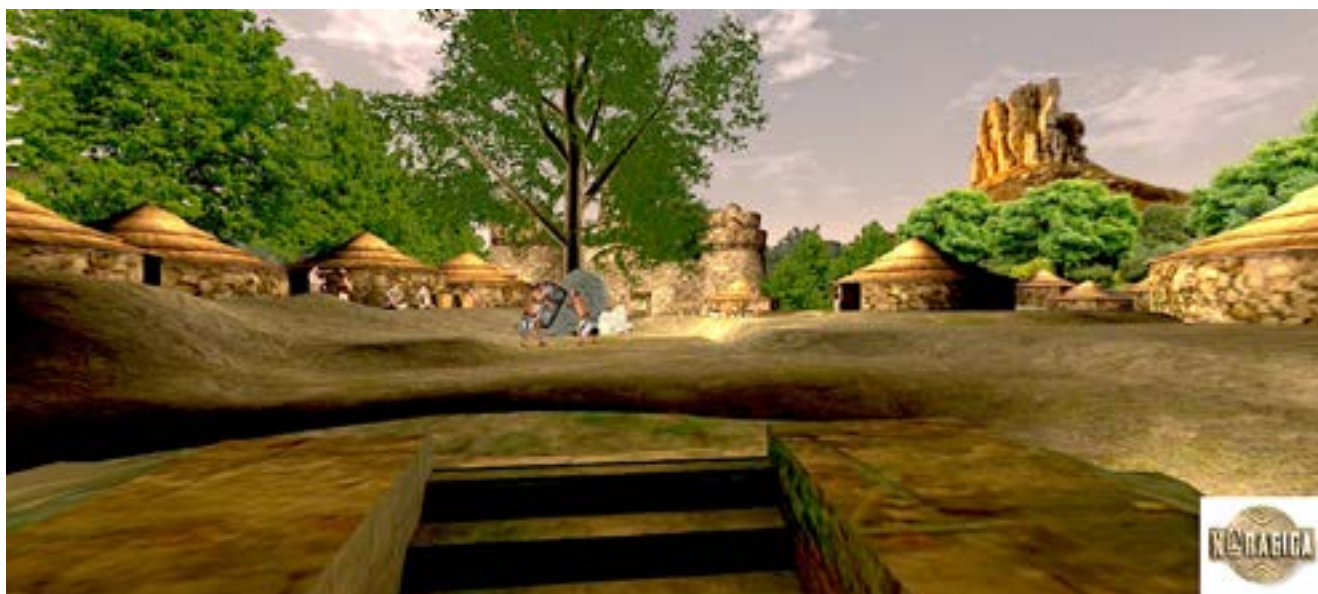
Extrait film 3D