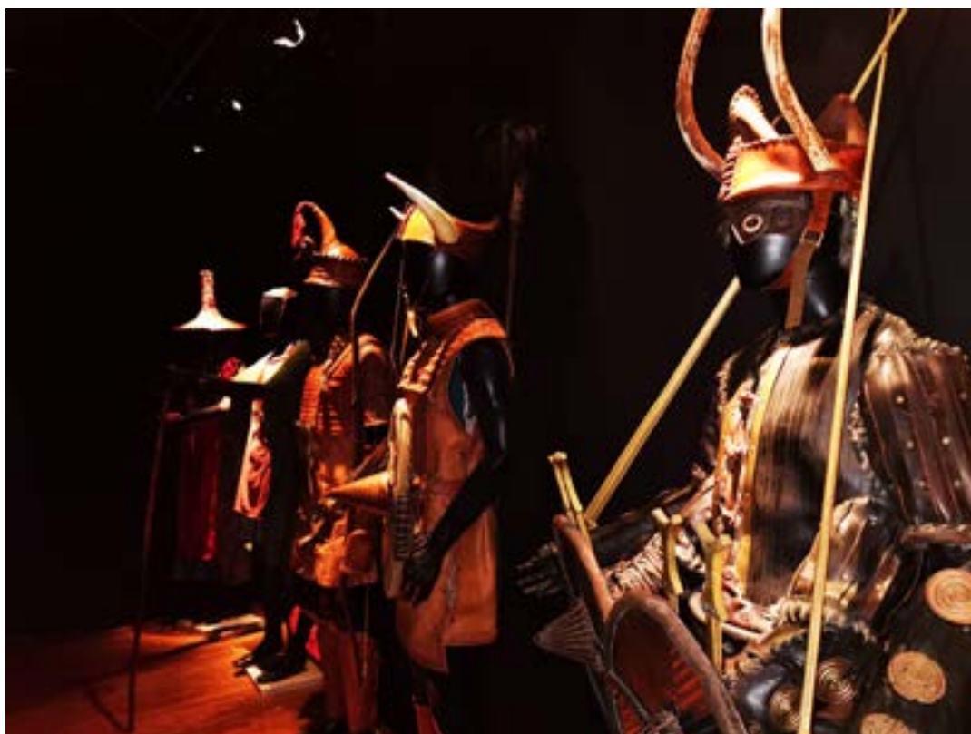
Reproduction de costumes nuragiques, ©Nova Istorica

Grâce à un travail conjoint entre experts corses et sardes, les contenus de Nuragica ont été enrichis par des parallèles sur l'évolution de la Corse, ses contacts et ses points communs avec la Sardaigne, notamment grâce à des découvertes récentes et, pour certaines, inédites.