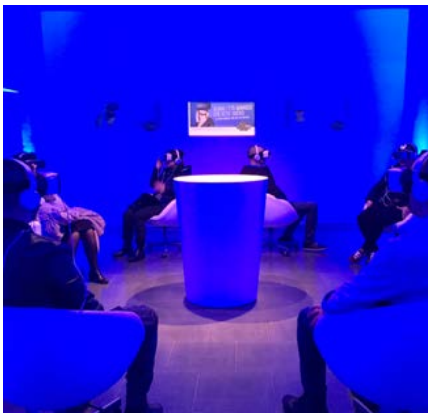
Salle de réalité virtuelle