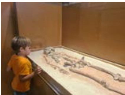
La dame de Bonifacio

Le premier peuplement connu de la Corse se fait vers -9000, avec l'arrivée de petits groupes par bateau. Afin de se nourrir, ces communautés pratiquent la prédation (pêche, piégeage, collectes diverses). Pour fabriquer leurs outils, ils utilisent des ressources essentiellement locales. Probablement nomades, ils occupent des abris naturels ou établissent des campements de plein air. Quelques tombes en grotte illustrent des pratiques funéraires complexes. Ces populations semblent disparaître vers -6400.