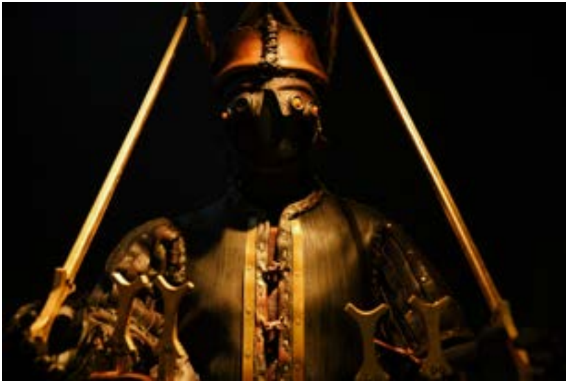
Guerrier nuragique, © Nova Istoria