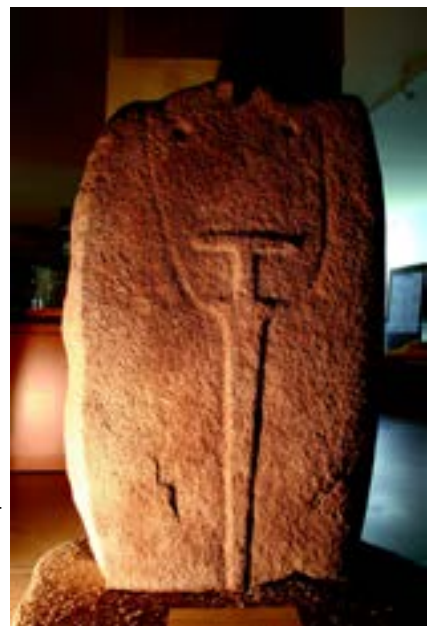
Fragment de la statue-menhir Aravina I

Dès le début de l'âge du Bronze, le sud de la Corse se couvre d'habitats fortifiés, les casteddi, alors que le territoire est ponctué de menhirs et statues-menhirs. Ces dernières représentent des chefs portant des attributs guerriers. L'apparition de ces élites, dont le pouvoir se fonde sur le contrôle des réseaux d'approvisionnement en métal et sur les capacités de stockage des ressources alimentaires, répond à un climat de tension. Du fait de nouveaux besoins (cuivre, étain, verre), les relations maritimes à distance se développent. Les sites de Cucuruzzu et d'Araghju constituent des exemples d'habitats de cette époque.