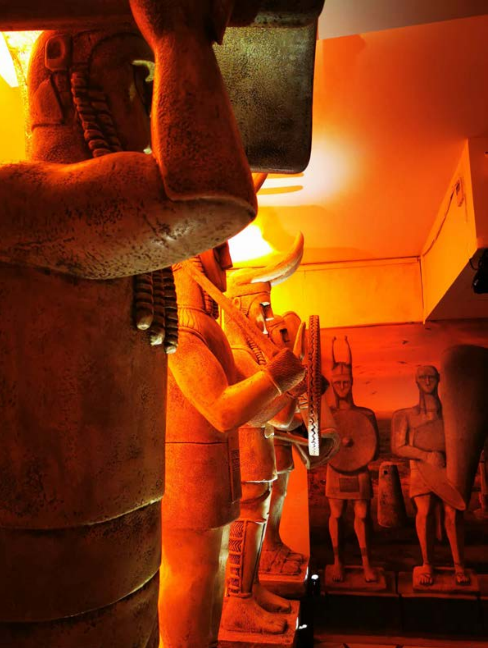
Reproduction à l'échelle 1:1 des géants de Mont' e Prama